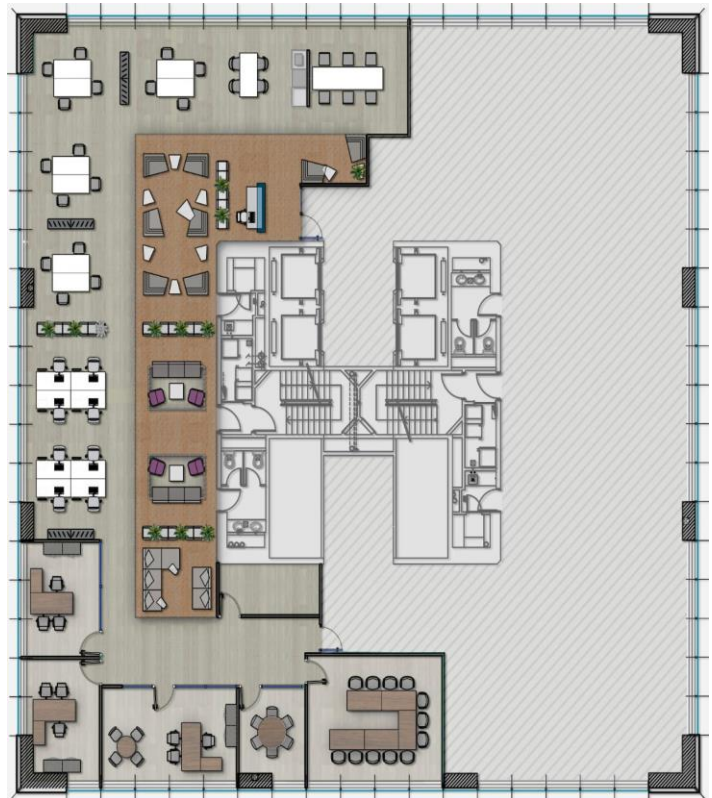
Lay out alternativo aprovechando divisiones actuales

Nota importante: Toda la información y medidas provistas son aproximadas y deberán ratificarse con la documentación pertinente y no compromete contractualmente a nuestra empresa. Los gastos (expensas, abl) expresados refieren a la última información recabada y deberán confirmarse. Fotografías no vinculantes ni contractuales.