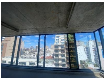
Pisos 11° y 12°

Nota importante: Toda la información y medidas provistas son aproximadas y deberán ratificarse con la documentación pertinente y no compromete contractualmente a nuestra empresa. Los gastos (expensas, abl) expresados refieren a la última información recabada y deberán confirmarse. Fotografías no vinculantes ni contractuales.