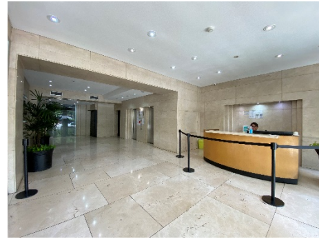
Categoría A. Curtain wall. Seguridad 24 hs.